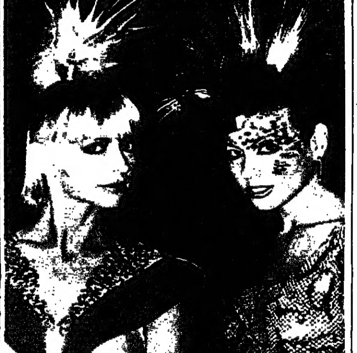
عارضتان لثلاثين تسريحتين جديبتين من الولايات المتحدة امس الاول في باريس ضمن مهرجان دولي لتسريح الشمر نظمته ٣٨ دولة لتطوير الموضة وتقديم تسريحات جديدة. ويبدو ان اليسار رجينا بتسريحة من تصميم جيري غوردون واليمين مدونا بتسريحة من تصميم دافيد بروواي (ب.ب.)